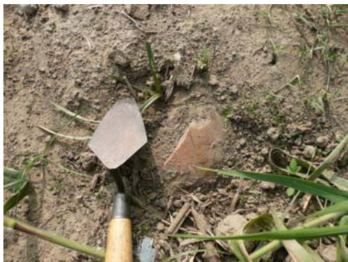
圖說：劉厝大排水南岸邊坡地表採集之遺物